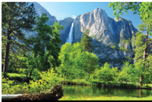
Parco Nazionale di Yosemite—Panorama

Il programma di viaggio qui riportato potrebbe aver subito piccole variazioni, consultare la pagina web corrispondente, costantemente aggiornata.