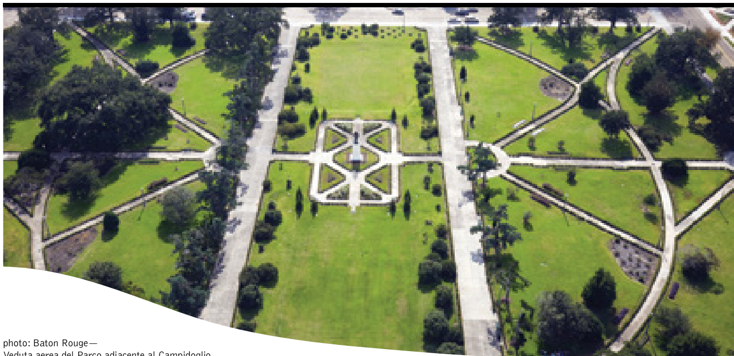
photo: Baton Rouge— Veduta aerea del Parco adiacente al Campidoglio

12 giorni / 11 notti. Da giugno ad agosto. Inizio/Fine tour: New York/New Orleans