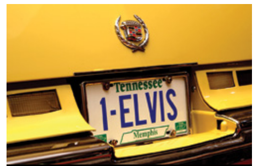
photo: New York—Central Park in autunno Memphis—La targa di una Cadillac