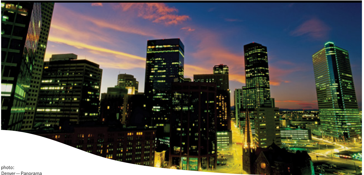
photo: Denver — Panorama

15 giorni / 14 notti. Da giugno a settembre. Inizio/Fine tour: Denver