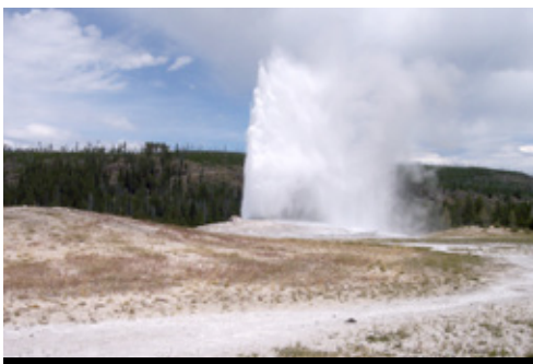
photo: Mt Rushmore—I quattro Presidenti Parco Nazionale di Yellowstone