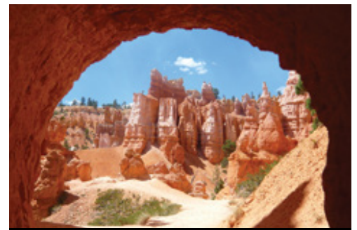
photo: Parco Nazionale di Monument Valley Parco Nazionale del Bryce Canyon