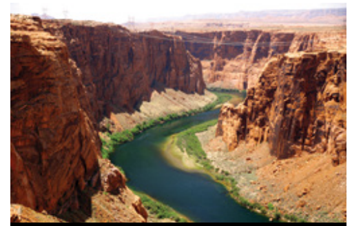
Parco Nazionale del Grand Canyon—Panorama

Il programma di viaggio qui riportato potrebbe aver subito piccole variazioni, consultare la pagina web corrispondente, costantemente aggiornata.