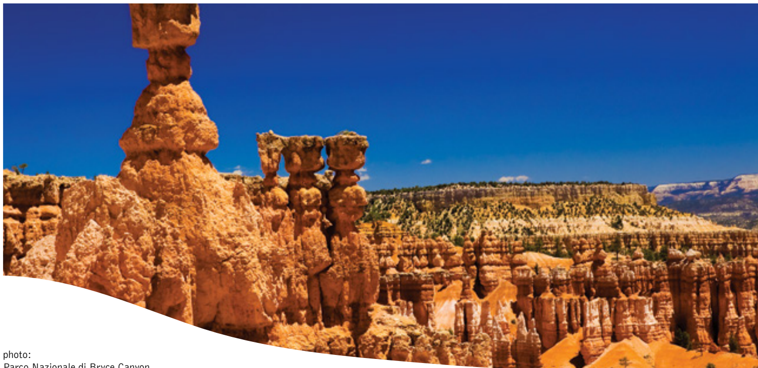
photo: Parco Nazionale di Bryce Canyon

17 giorni / 16 notti. Da aprile a ottobre. Inizio/Fine tour: Los Angeles/New York