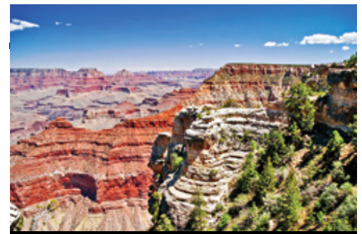
photo: Parco Nazionale del Grand Canyon—Panorama San Francisco—Panorama