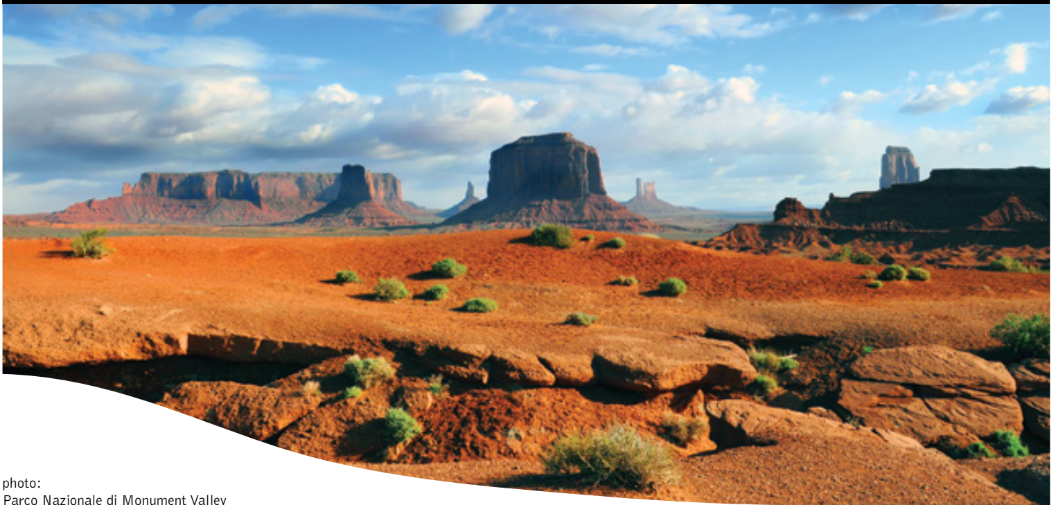
photo: Parco Nazionale di Monument Valley

15 giorni / 14 notti. Da aprile a ottobre. Inizio/Fine tour: New York/Los Angeles