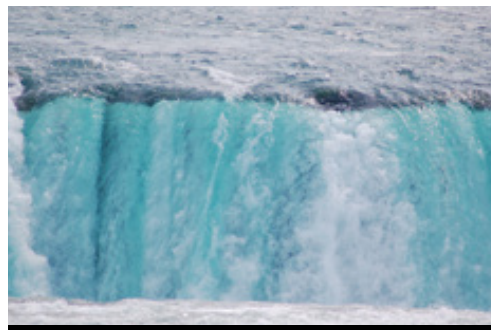
photo: Cascate del Niagara

Il Queens, così chiamato per onorare Caterina di Braganza, Regina di Inghilterra, Scozia e Irlanda, è il distretto più vasto di New York City. Fra le sue attrazioni più famose, il Flushing Meadows-Corona Park, creato originariamente per la Fiera Internazionale del Mondo nel 1939/40, ospita alcuni dei simboli del Queens a New York, come il Citi Field, lo Stadio ufficiale dei New York Mets, il Queens Museum of Art, lo Zoo del Queens, lo Stadio dove hanno sede gli US Open. Altri punti di interesse includono gli Studi televisivi Kaufmann, il quartiere greco di Astoria e il quartiere multietnico di Jackson Height. Se Brooklyn fosse una città indipendente, sarebbe la 4 città degli Stati Uniti, seconda solo a Chicago, con più di 2.6 milioni di residenti. Proprio la sua grandezza, ne rende una visita completa pressoché impossibile. Il tour si concentra