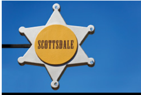
photo: Scottsdale, AZ Parco Nazionale del Grand Canyon, AZ—Panorama