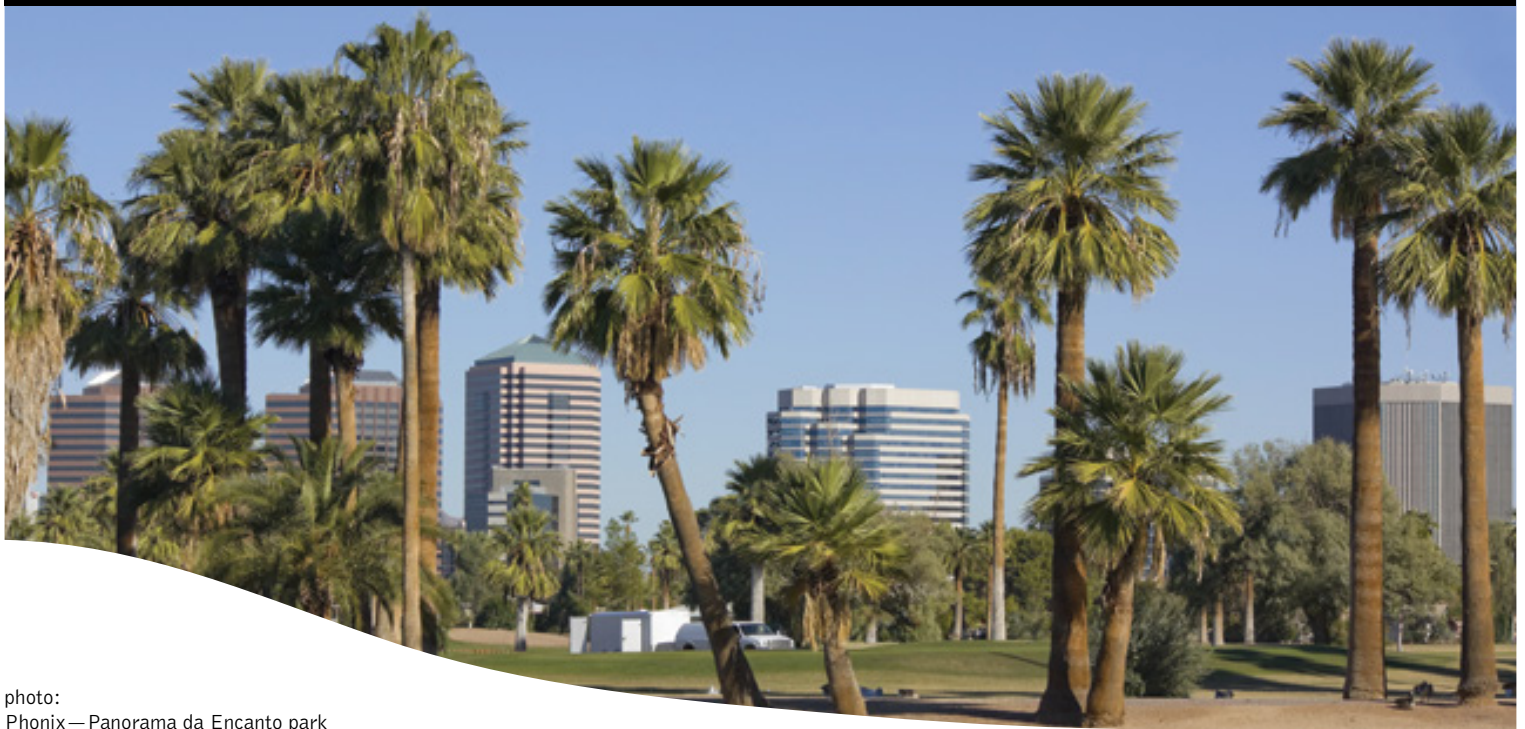
Panorama da Encanto park

10 giorni / 9 notti. Da giugno a settembre. Inizio/Fine tour: Las Vegas