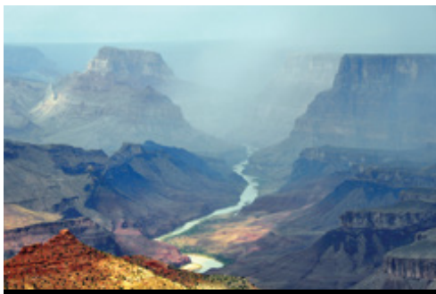
photo: Las Vegas — Gli hotel Parco Nazionale del Grand Canyon — Panorama

In hotel, dopo aver effettuato il check in, avrete a disposizione nella lobby il concierge Volatour aperto tutti i giorni dalle 8 alle 16 con personale italiano. Il vostro hotel si trova letteralmente nel cuore di NY! New York City, conosciuta anche come la Grande Mela, è una delle più vibranti e cosmopolite città del mondo, ogni suo angolo è ricco di gallerie, musei, teatri, ristoranti e negozi per un indimenticabile shopping! Pernottamento in albergo.