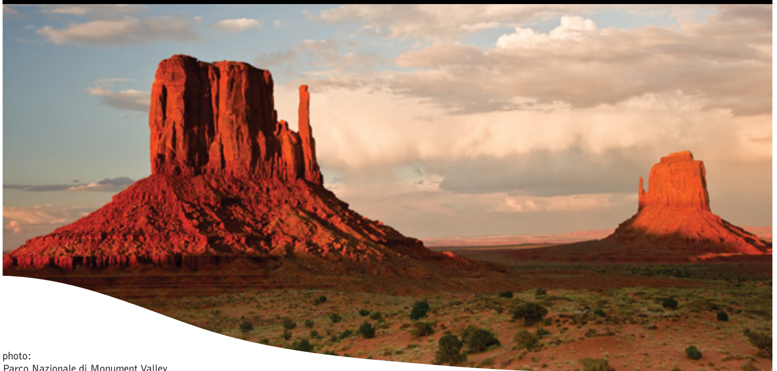
photo: Parco Nazionale di Monument Valley

12 giorni / 11 notti. Da giugno a settembre. Inizio/Fine tour: Los Angeles/Las Vegas