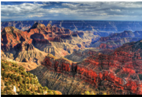
photo: Parco Nazionale del Bryce Canyon— Panorama Parco Nazionale del Grand Canyon— Panorama

Arrivo a New York e trasferimento all'Hotel Riu Plaza Times Square. In hotel, dopo aver effettuato il check in, avrete a disposizione nella lobby il concierge Volatour aperto tutti i giorni dalle 8 alle 16 con personale italiano. Il vostro hotel si trova letteralmente nel cuore di NY! New York City, conosciuta anche come la Grande Mela, è una delle più vibranti e cosmopolite città del mondo, ogni suo angolo è ricco di gallerie, musei, teatri, ristoranti e negozi per un indimenticabile shopping! Pernottamento in albergo.