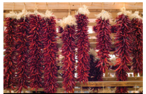
photo: Parco Nazionale di Mesa Verde Santa Fe—Trecce di peperoncini piccanti