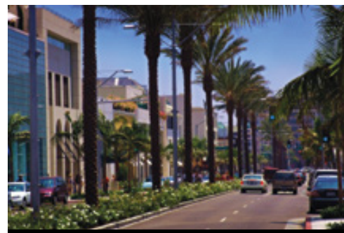
photo: Parco Nazionale del Grand Canyon — Panorama Los Angeles — Rodeo Drive