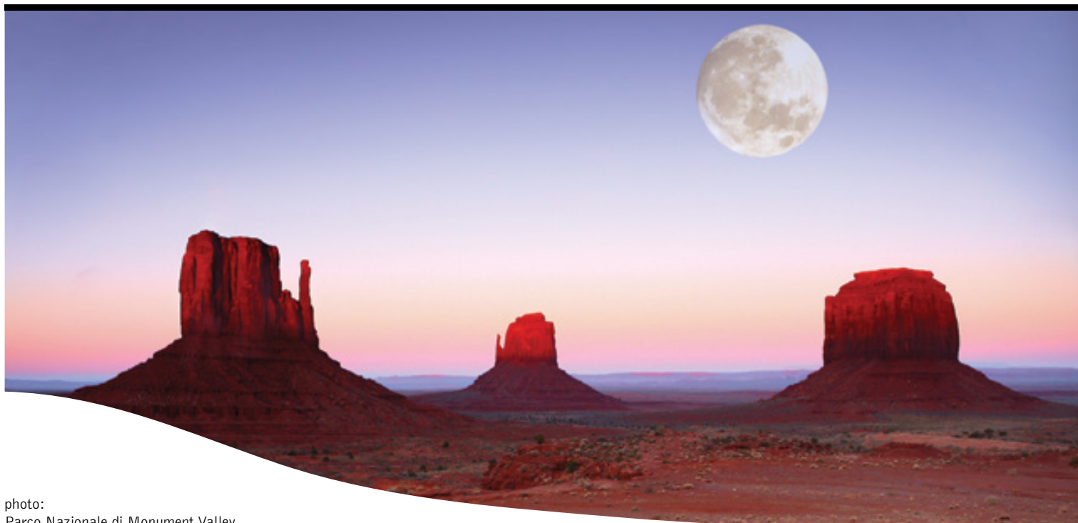
photo: Parco Nazionale di Monument Valley

9 giorni / 8 notti. Da maggio a ottobre. Inizio/Fine tour: Los Angeles