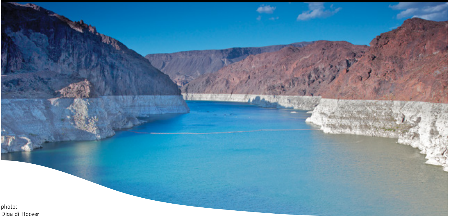
photo: Diga di Hoover

11 giorni / 10 notti. Da aprile a ottobre. Inizio/Fine tour: Los Angeles/San Francisco