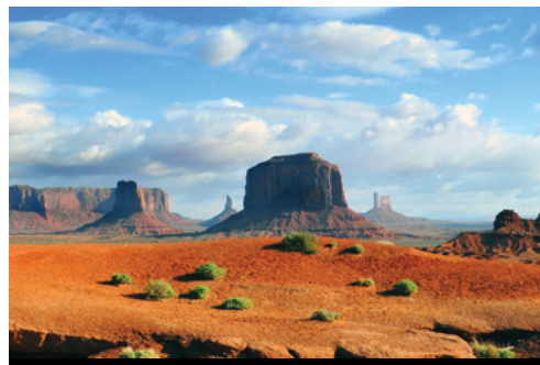
photo: Los Angeles—Panorama notturno Parco Nazionale di Monument Valley